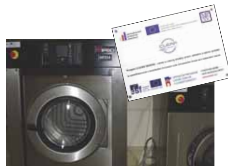
Provozovna prádelny Clear Servis o. p. s.

Pracovní uplatnění nabízí také firma Active Colour, s. r. o., z Valašského Meziříčí, která z dotace pořídila tech-