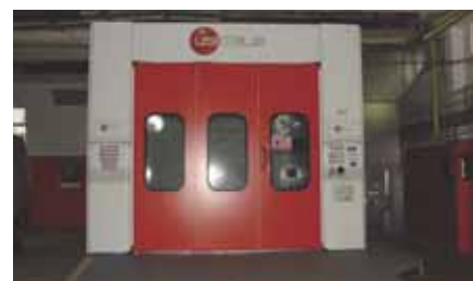
Technologie mokrého lakování – Lakovna Active Colour, s. r. o.

nologie pro provoz lakovny (box pro mokré lakování). V provozu jsou zaměstnány 3 osoby z cílových skupin.